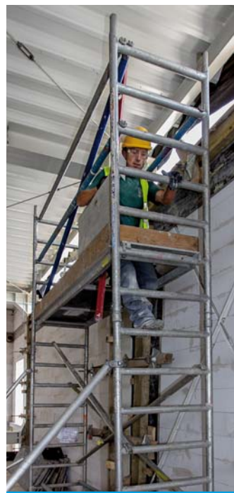
Поміст з лазом, який закривається