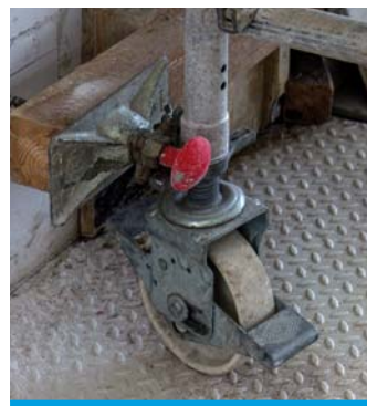
Гальмо рухомого риштування